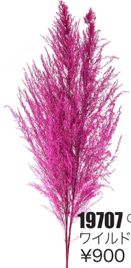
19707 C/D9 ワイルドピンク ¥900 -10