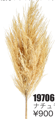
19706 C/D2 ナチュラル ¥900 -10

□アンデスパンパス・ツリートップ 束/2本 H70cm ペルー産 穂先だけのタイプです。