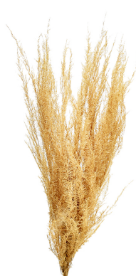
17532 C/D9 ヒモケイトウ HL N.グリーン 束/約30g H70cm オランダ産 ¥900 -5