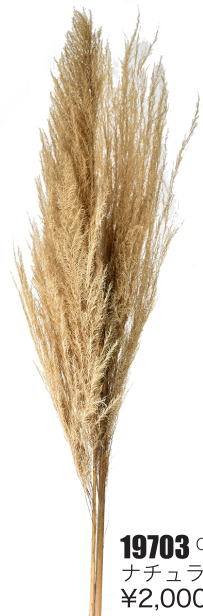
19703 C/D1 ナチュラル ¥2,000 -5

□アンデスパンパス・ボディ&ステム 束/2本 H100cm ペルー産 ステムと穂のタイプです。