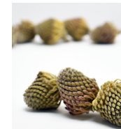
17618 C/D5 ピンクッション・スプラウト N. 袋/約40g 2-4cm 南ア ¥800 -5