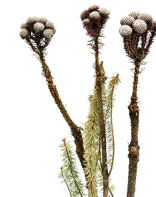
17612 C/D8 ストコエイ ナチュラル 束/約3本 H60cm 南アフリカ産 ¥1,000 -5 ワイルドなブルニア風。