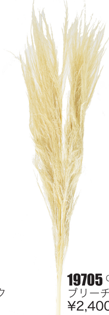
19705 C/D5 ブリーチ ¥2,400 -5

□アンデスパンパス・ツリートップ 束/2本 H70cm ペルー産 穂先だけのタイプです。