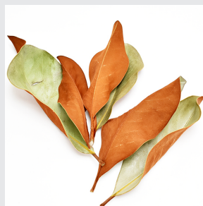
12301 C/D6 マグノリアリーフ・チップ ナチュラル 袋/10枚 10cm程度 アメリカ・ニュージーランド産 ¥1,000 -5

コンセプトは、無駄にしない！商品化してゆく過程でどうしても葉落ちや花落ちが発生してしまいます。もったいないと想いつつも捨ててしまう事が多かったのですが心入れ替え、一生懸命に集めてみました。そんな商品をシリーズ化。限定となりますのであるうちにご購入ください。