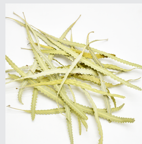
12302 C/D3 バンクシアリーフ・チップ ナチュラル 袋/30g・15cm程度 オーストラリア・南アフリカ産 ¥700 -5