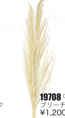
19708 C/D6 ブリーチ ¥1,200 -10

アンデス山脈の風に耐え忍んだ、パンパスです。よりナチュラル感満載のパンパスですが、非常に長い状態で入荷した為バランスを考えカットしての販売となります。 ボディ&ステム…しっかりとしたステムに穂先がついています。長さも約100cmですのでディスプレイなどに使えます。 ツリートップ……ボディ&ステムの先部分をカットしました。いろいろなシーンで使用できるとおもいます。 ブランチ……穂先だけです。シュワシュワとした感じは現在欠品中のスティファの代替えとして使えます。長さはランダムなのでご了承ください。