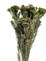
17611 C/D5 アルビフローラ・グリーンヘッド ナチュラル 束/2-3本 H50cm 南アフリカ産 ¥1,100 -5 これ結構オススメです。ヘッドのグリーンがかっこいいですよ。