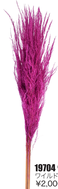
19704 C/D8 ワイルドピンク ¥2,000 -5